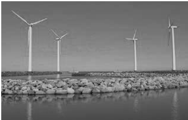
Windenergieanlagen an der dänischen Küste

und auch auf offener See ist dies oft problematisch, trotz des guten Windangebots. Windenergieanlagen dürfen nicht zu dicht beieinander aufgestellt werden, der Standort sollte nicht zu nahe an Wohnhäusern liegen; auch die Nähe zu Straßen und Wegen kann problematisch sein wegen der Gefahr des Eiswurfes (wenn sich einem Rotor anhaftendes Eis plötzlich löst). Die Nähe zu Vogelschutzgebieten ist auch zu vermeiden.