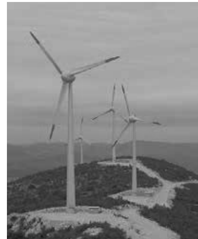
Windpark Trtar-Krtolin (Šibenik)

Die von einer Windenergieanlage erzeugte elektrische Leistung hängt sehr stark von der Windgeschwindigkeit und dem Standort ab. Der Standort sollte möglichst gut zugänglich sein, um die Montage und die Wartung zu erleichtern. In Bergregionen