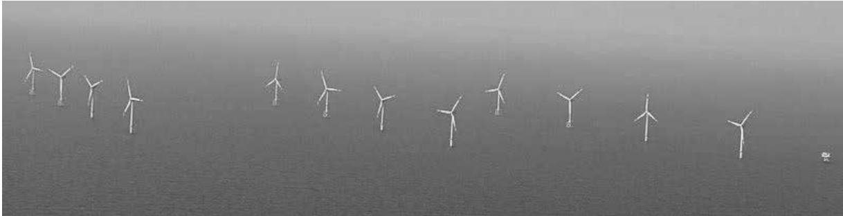
Windenergieanlagen des Offshore-Windparks alpha ventus in der Deutschen Bucht

Eine Windenergieanlage (WEA) ist ein Kraftwerk, das Windenergie in elektrischen Strom umwandelt.