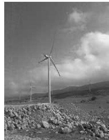
Windenergieanlage Vrataruša (Senj)

Die heutigen Windenergieanlagen entwickelten sich aus der Windmühlentechnik. Die ersten Anlagen zur Stromerzeugung sind Ende des 19. Jahrhunderts entstanden. In den letzten Jahren des 20. Jahrhunderts erlebte der Bau von Windenergieanlagen einen Boom, und auch zu Anfang des 21. Jahrhunderts setzte sich der deutliche Aufschwung fort.