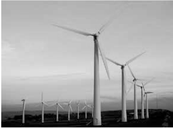
Royd Moor Windpark

und auch auf offener See ist dies oft problematisch, trotz des guten Windangebots. Windenergieanlagen dürfen nicht zu dicht beieinander aufgestellt werden, der Standort sollte nicht zu nahe an Wohnhäusern liegen; auch die Nähe zu Straßen und Wegen kann problematisch sein wegen der Gefahr des Eiswurfes (wenn sich einem Rotor anhaftendes Eis plötzlich löst). Die Nähe zu Vogelschutzgebieten ist auch zu vermeiden.