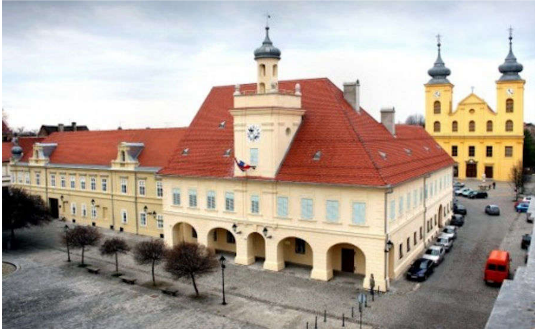
Slika 2. Arheološki muzej Osijek

ZAVIČAJNI MUZEJ NAŠICE osnovala je 1974. tadašnja Općina Našice i smjestila ga u nekoliko prostorija u Dvorcu Pejačević