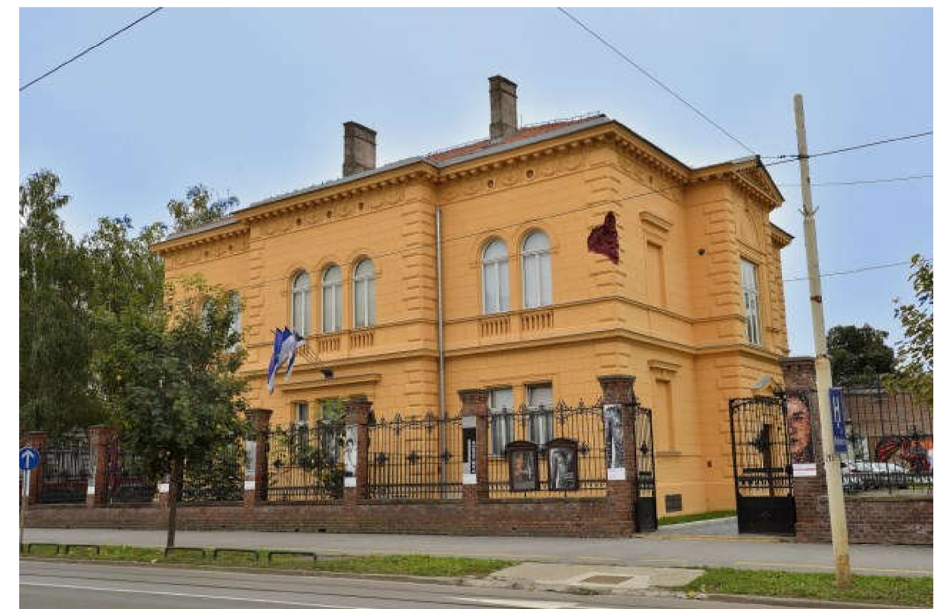
Slika 3. Muzej likovnih umjetnosti

MUZEJ VALPOVŠTINE osnovala je 1956. godine Društvo prijatelja starina Valpovo, a smješten je u valpovačkom dvorcu Prandau Normann