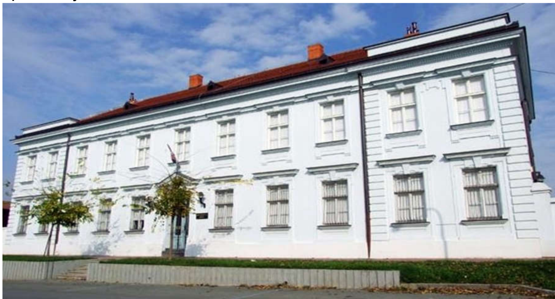
Slika 6. Muzej Đakovštine