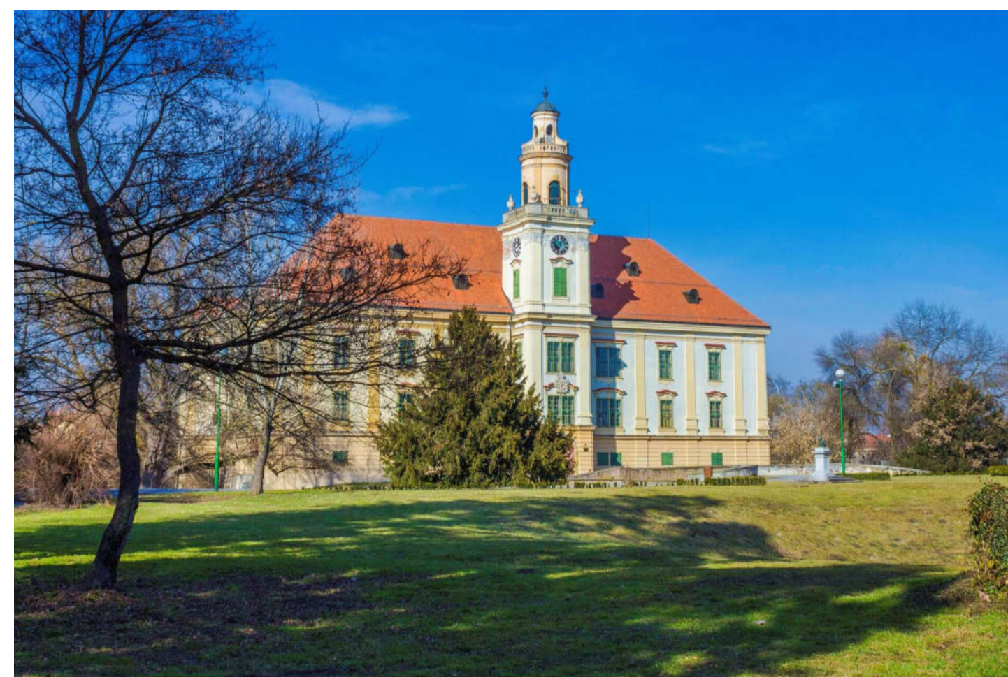
Slika 5. Muzej Valpovštine

MUZEJ SLAVONIJE osnovan je 1877. godine kao Muzej slobodnog i kraljevskog grada Osijeka