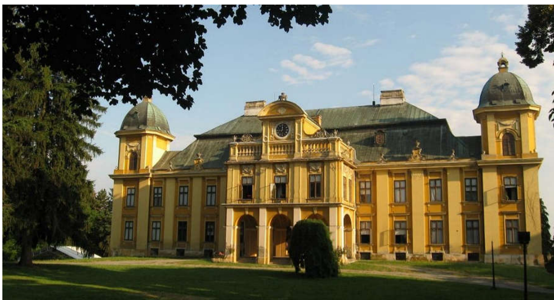
Slika 4. Zavičajni muzej Našice

MUZEJ ĐAKOVŠTINE osnovan je u prosincu 1951. godine